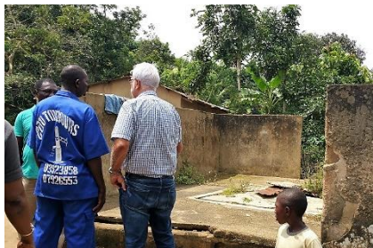
Demande de réhabilitation d' un puits dans un campement (village) dénommé Jérusalem

A chaque village visité avec son puits réhabilité, j' ai pu m' entretenir avec la population bénéficiaire très heureuse d' avoir enfin de l'eau potable...ce qui change totalement la vie des habitants et éloigne le danger de maladies hydriques dû aux eaux des marigots impropres à la consommation d' où de nombreux décès d' enfants. Tous les acteurs de cette belle action en France et en Côte d'Ivoire peuvent légitimement être fiers de leur participation bénévole.