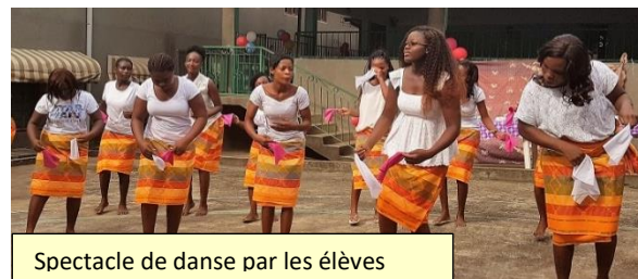
Spectacle de danse par les élèves