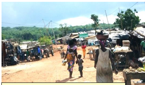
Arrivée au village Km30

Bien sûr ces puits n'ont pas la même finition que ceux qui sont réhabilités récemment mais à la grande satisfaction des villageois, ils