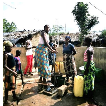
Le puits est très utilisé

Bien sûr ces puits n'ont pas la même finition que ceux qui sont réhabilités récemment mais à la grande satisfaction des villageois, ils