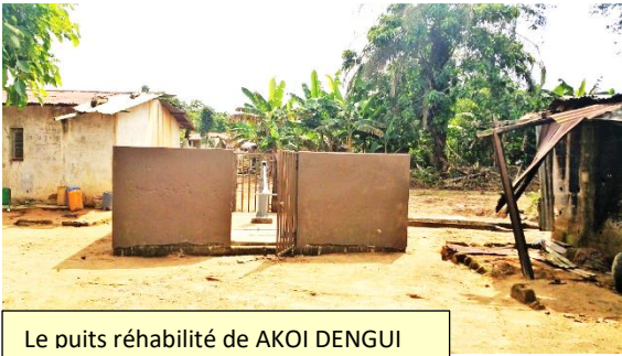
Le puits réhabilité de AKOI DENGUI