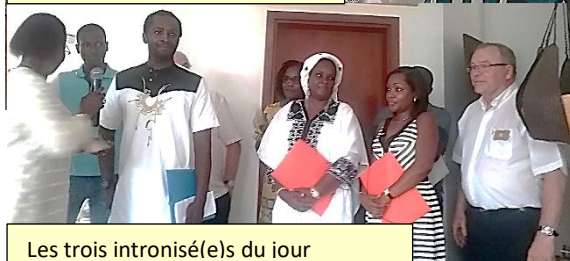
Les trois intronisé(e)s du jour