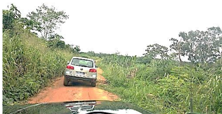
Piste pour aller au village de AKOI DENGUI