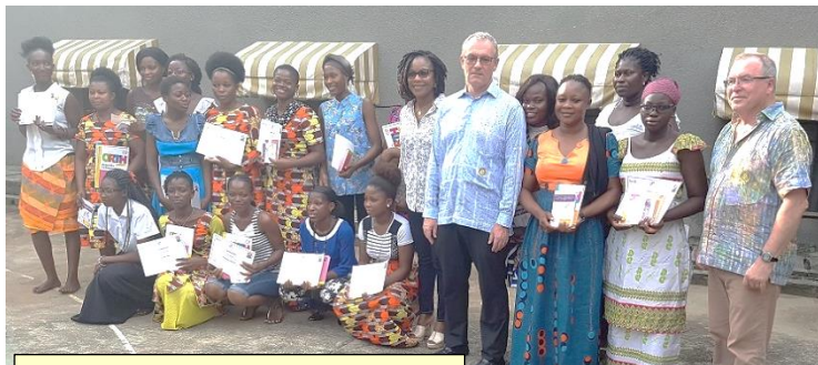
Avec les diplômées

Comme l’an passé, toujours grâce à l’apport financier apporté par les « ananas du cœur » et au travail du RC Abidjan, des bourses sont délivrées chaque année à des centres d’alphabétisation en faveur des élèves les plus méritants pour les encourager en leur payant leur année d’études. C’est ainsi que le centre « Congrégation