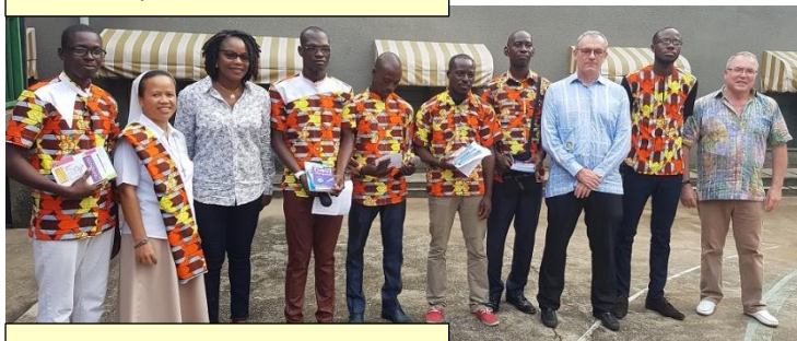
Avec les professeur(s)

St Joseph » a reçu, en ma présence cette année, un chèque de 500 000 CFA. Nous avons remis les diplômes à chaque bénéficiaire. Un petit spectacle monté pour nous remercier a suivi ainsi qu’une collation avec les professeurs.